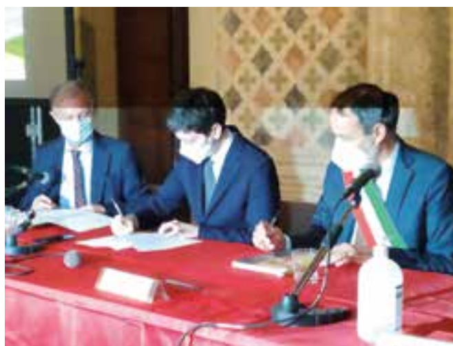
Il Ministro Speranza (al centro) mentre firma l'accordo